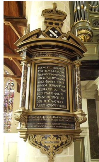
Rouwschrift Oude Kerk ter nagedachtenis