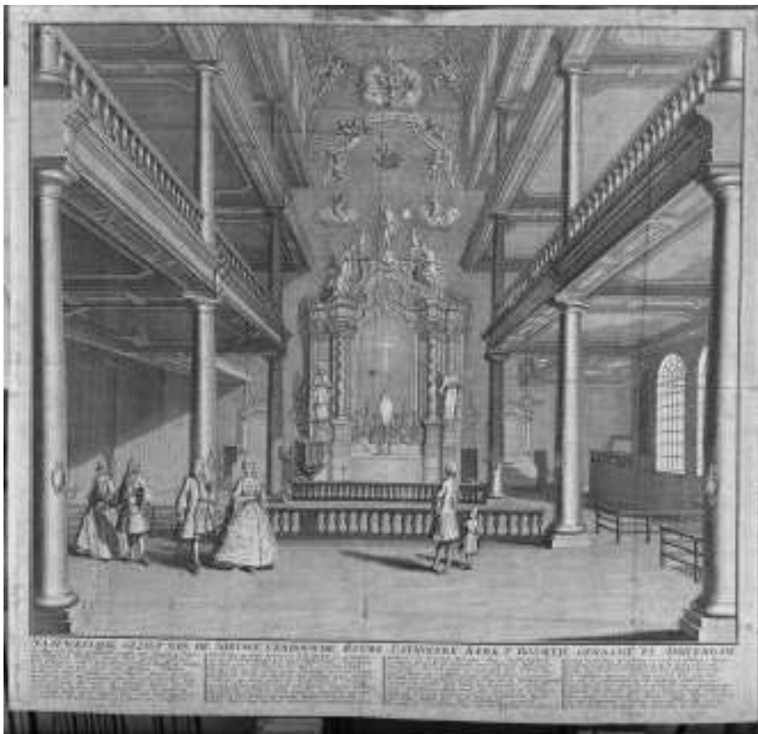
Uit de beeldbank van Amsterdam een prent van 't Boompje (een schuilkelder).