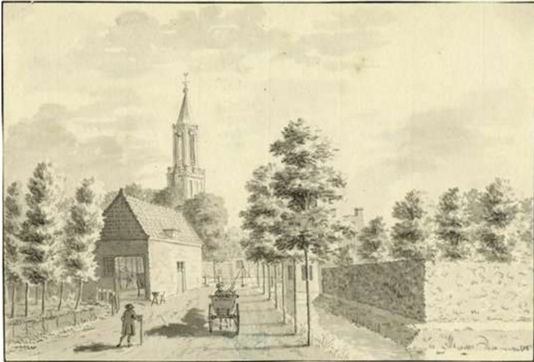
Gezicht op de Slootdijk te Loenen in 1728 uit het noord-westen, met op de achtergrond de Toren van de Nederlands Hervormde kerk.

N.B. de naam Slootdijk is later gewijzigd in Rijksstraatweg, (Serrurier, L.P. tekenaar)