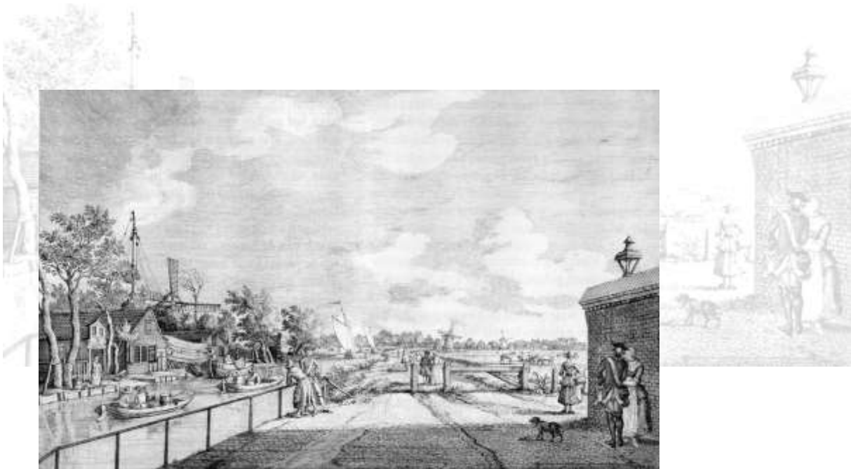
Zicht op 't Sluijsje vanaf het Zieken (ca. 1760). Van links naar rechts: 't Sluijsje aan de Haagvliet met de herberg Pas Buiten, de scheepswerf en daarachter de Oude Veenmolen. De Laakmolen. De Broekslootmolen. De muur van het Leprozenhuis. Pas Buiten de herberg waar Jacob Trumpi is overleden in november 1782.

Paulus Constantijn la Fargue - Haags Gemeentearchief prent Gr B 245/6/7